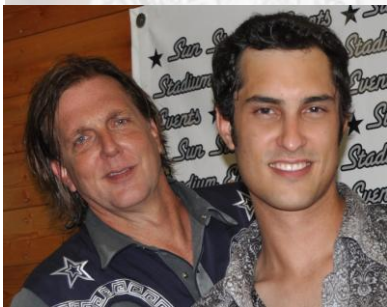
Père & Fils